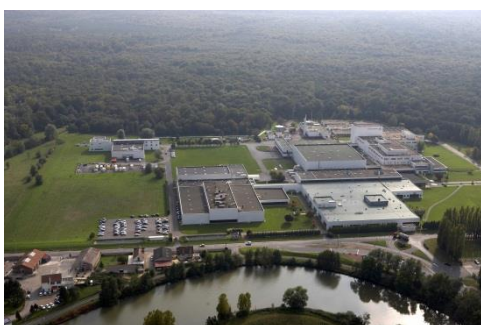
Le site Sanofi de Compiègne, 2016.

Compiègne, France - Le 17 juin 2016 - Le site de Sanofi de Compiègne célèbre aujourd'hui ses 50 ans. Depuis 1966, ce site œuvre pour la santé des patients en fabriquant des médicaments sous forme de gélules, de comprimés et de poudres dans le domaine des antidouleurs, des antiallergiques ou encore des médicaments pour les patients atteints de sclérose en plaques. Il comprend également une activité de conditionnement et un centre de développement pour les formes galéniques.