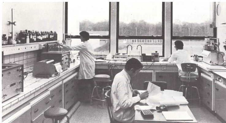
Le laboratoire de contrôle, 1966.