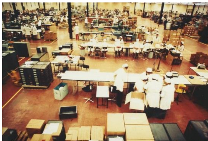
Les ateliers, 1966.